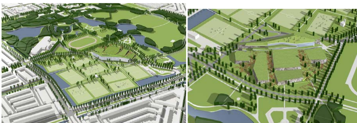
Toekomstige Sportcampus in het Zuiderpark waar ook de zeilers komen te wonen (gerekend 2014-2015)